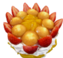
■クリスマスケーキ 12月12日