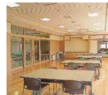
地域の方々との交流の場をご提供いたします