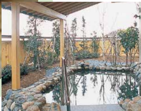
露天風呂もあり、いつでも温泉気分