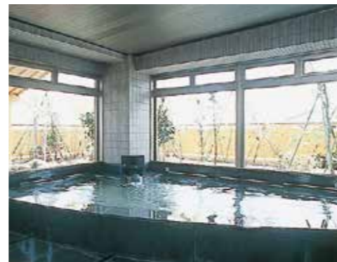
庭園と眺望の楽しめる温泉浴室