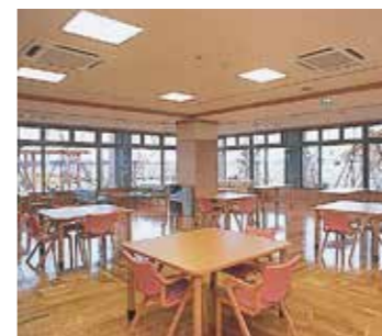
床暖房採用の広く明るい食堂