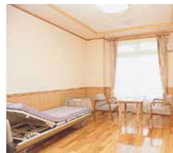
木の温もりの中で過ごせる居室