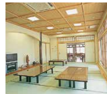
和室でゆったりとしたひとときを